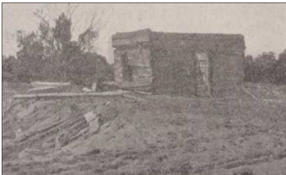
“Beaver Creek prækeplass”.

Foto henta frå boka “Norsk Lutherske Menigheter i Amerika”. Skrevet av pastor O. M. Nordli og kom ut i Minneapolis 1918.