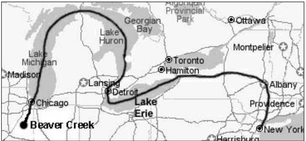
Kart over reiseruta til "Ægirfolket".