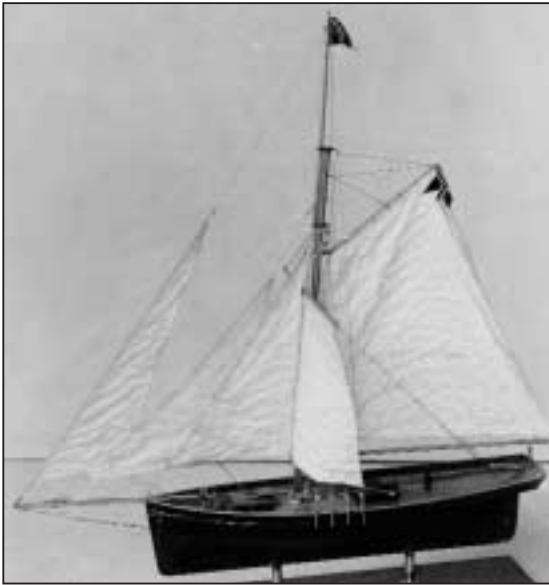
Modell av Restaurationen.

hvordan emigrantskipene burde utstyres og tilpasses for og befordre passasjerer på en slik lang reise.