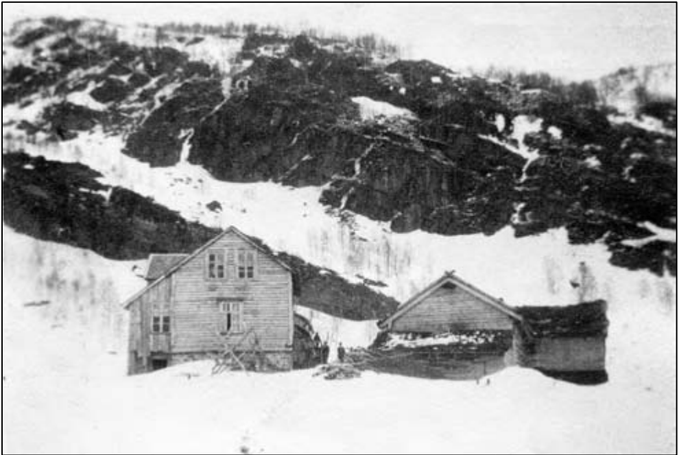
Berge bnr. 1.